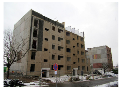
Jakobstraße 16 - 24