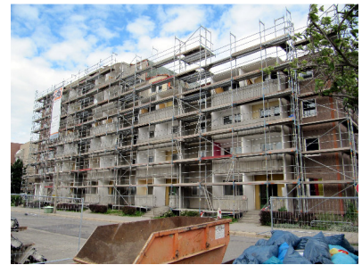
Jakobstraße 31 - 39

31.August Das Haus Pestalozzistraße wurde bei einer Grundstücksauktion in Dresden für 99.000 Euro versteigert.