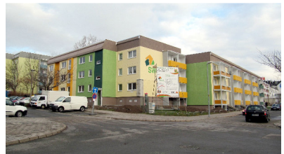
Martinstraße 14-24 und Jakobstraße 31-39