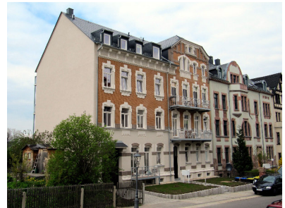
Hofer Straße 33