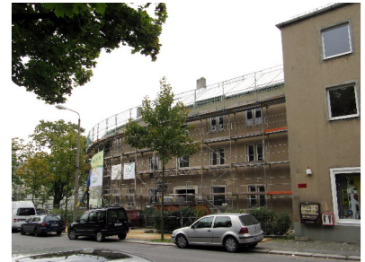
Fürstenstraße 128 - 130

Ende August Die Sanierung der GGG-Häuser auf der Humboldthöhe beginnt mit der Fürstenstraße 128-130 und der Münchner Straße 31-35