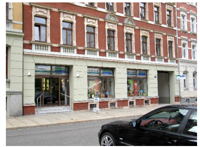
ORTHOKA - Philippstraße 18