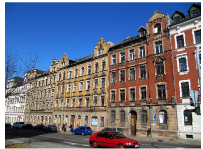
Fürstenstraße 49 - 53