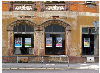
Plakate in der Augustusburger Straße 102