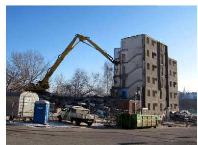
Martinstraße 10 - 12