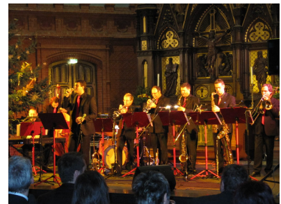
Benefizkonzert in der St. Markuskirche