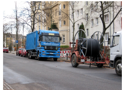
Breitbandkabel Würzburger Straße