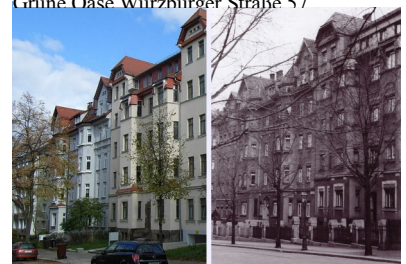
100 Jahre Würzburger Straße 32 und 34

18. Oktober Drei weitere Stolpersteine werden von dem Kölner Künstler Gunter Demnig u.a. auf dem Sonnenberg eingefügt; an der Hofer Straße 4 für die Lehrtochter Elisabeth Voigt, Opfer der nationalsozialistischen Euthanasieverbrechen und an der Fürstenstraße 12 für Moritz und Masza Zudkowitz, polnische Eheleute, die Ende Oktober 1938 nach Polen ausgewiesen und im Vernichtungslager Chelmo ermordet wurden.