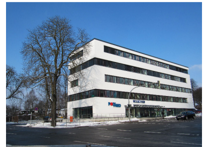
POLYMED Yorckstraße 35