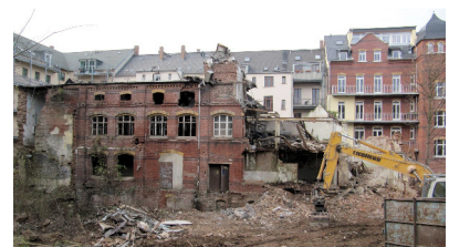
Markusstraße 32 – Alte Molkerei