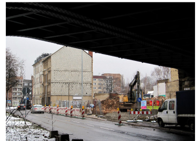
Ehemalige Gaststätte „Pferde Hofmann“