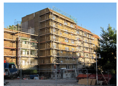
Martinstraße 18 - 24

10.September 1.Chemnitzer Straßentheaterfest auf dem Sonnenberg in der Körnerstraße mit vielen Attraktionen für groß und klein und für alle erschwinglich. Das 300.Bild der Straßengalerie wurde angebracht und die Gewinner des Literaturwettbewerbes „SONNENBERG SCHREIBT“ gekürt.