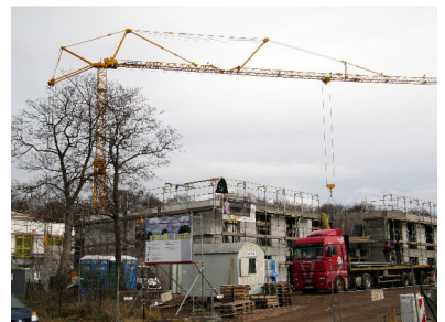
Richtfest Planitzwiese 31