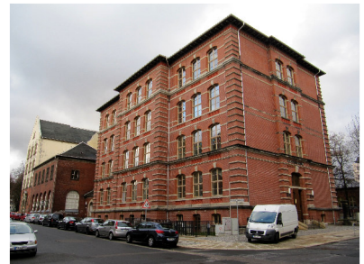
Lessing-Grundschule Reinhardtstraße 6