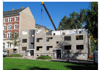
Tschaikowskistraße 16 - 18

01.September Beginn des Abbruchs der Häuser Tschaikowskistraße 16-18