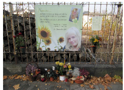
Dresdner Straße-Einmündung Fürstenstraße