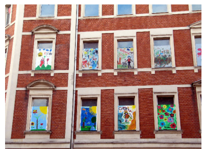
Straßengalerie Körnerstraße 18