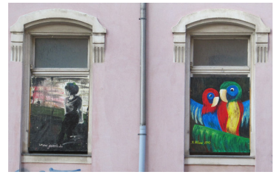
Straßengalerie – Zietenstraße 36