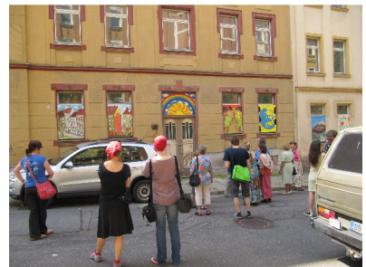
Führung durch die Straßengalerie