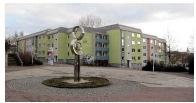
Sonnenstraße 52-58 - Martinstraße 18-24