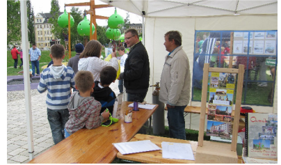
Stadtteilfest - AG Sonnenberg-Geschichte