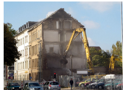
Augustusburger Straße 45

29.November Das Haus Zietenstraße 33 wird auf einer Grundstücksauktion in Dresden für 14.500 Euro versteigert.