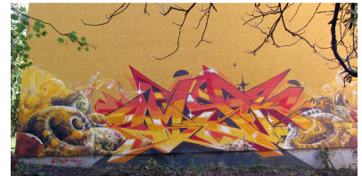
Graffiti Paul-Gerhardt-Straße 65