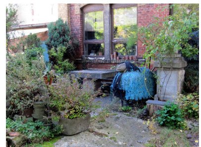
Grüne Oase Würzburger Straße 57