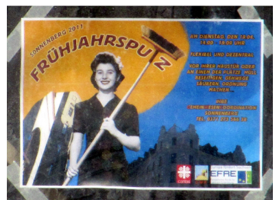
Aufruf zum Frühjahrsputz