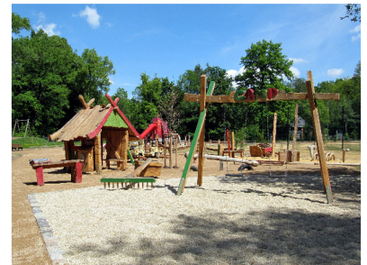
Spielplatz im Zeisigwald